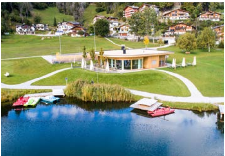
Ustria Lags, Laax