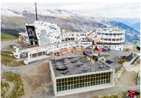
Sonnenterasse Crap Sogn Gion, Laax